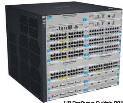
HP ProCurve Switch 8212zl