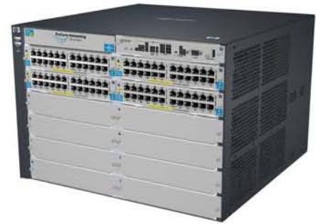
HP ProCurve Switch 5412zl

“我们是一家广告公司，项目工期总是非常紧张，大多数员工需要加班加点才能完成，因此宕机机会给我们带来巨大损失。我们要求网络设备和应用程序24 x 7可用，如果网络停运一天，员工就无法开展任何工作，而我还要为他们支付这一天的工资。一旦丢失电子邮件等重要数据，企业就有可能失去大笔业务，还会引起客户不满。”